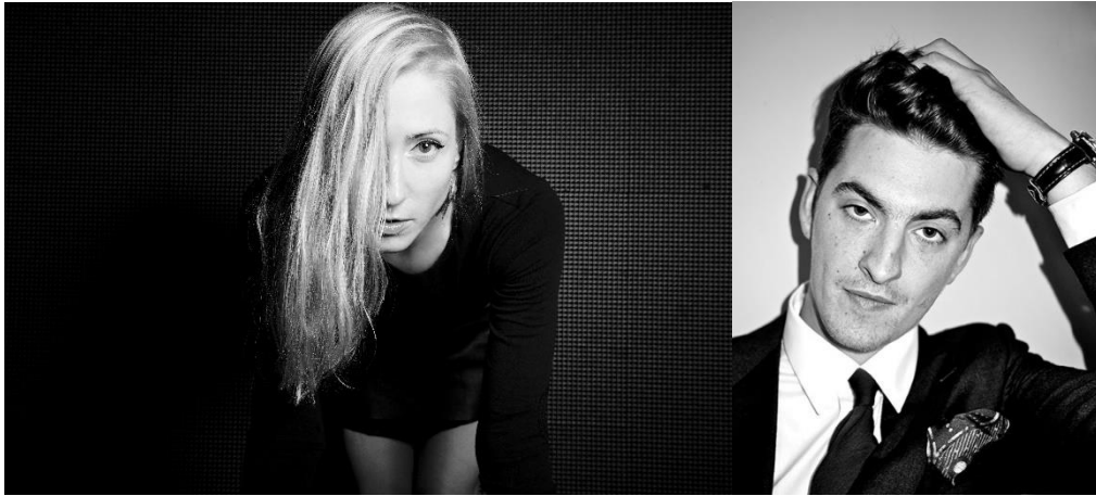
v.l.n.r.: Ellen Allien, Skream

Sehr speziell ist aber bereits der Donnerstag, 7.Mai.: Der Klub Mutti tritt als Gastgeber unter dem Motto „Metamorphösen“ mit Spaß, Drag und Performance auf; das Besondere: aus dem Umfeld des Klub Mutti stammen auch die Models für die diesjährige grafische poolbar-Linie. Das Line-Up sorgt damit für ein abwechslungsreiches Festival-Wochenende, das ergänzt wird durch Kulinarik, Kunst und Mode.